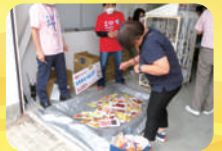
おつまみ釣りの様子