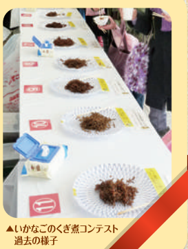
▲いかなごのくぎ煮コンテスト過去の様子

※いかなご漁の状況によっては、商品のご用意並びにいかなごのくぎ煮コンテストの開催ができない場合もございます。予めご了承くださいませようお願い申し上げます。