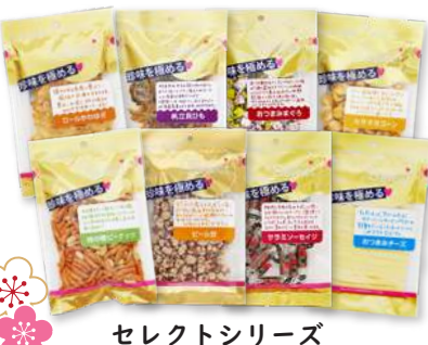
セレクトシリーズ