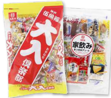
大人倶楽部、家飲みおつまみアソート