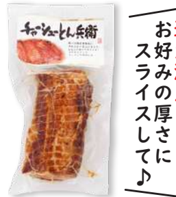
チャーシューとん兵衛